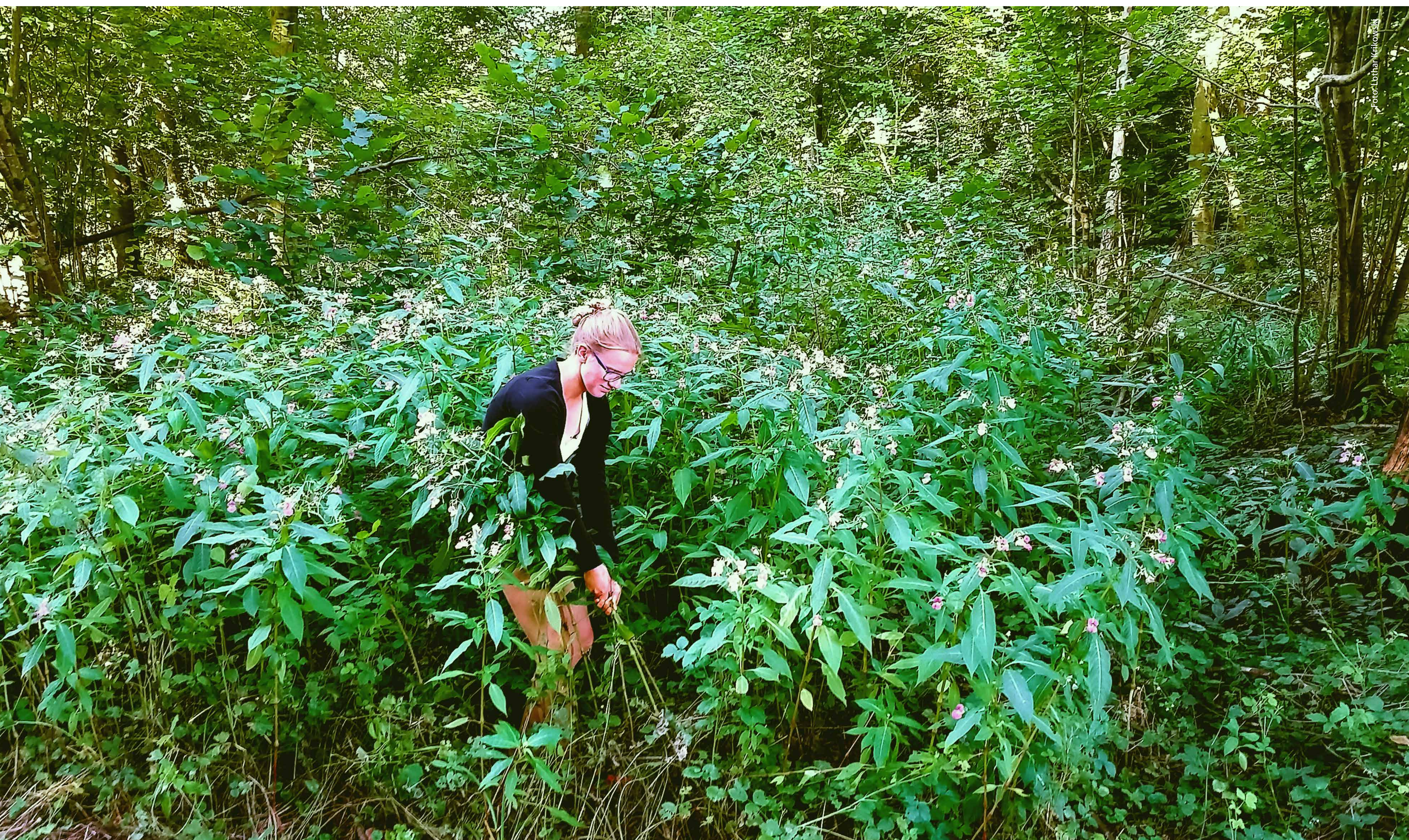
Indisches Springkraut lässt sich einfach ausreißen